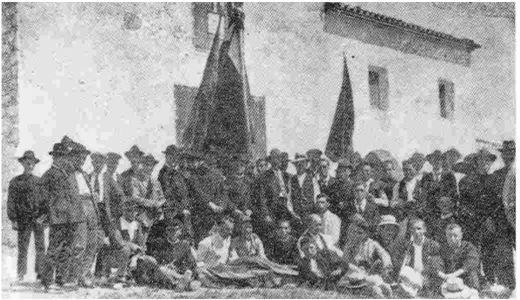
Aplec del Puig de 1917